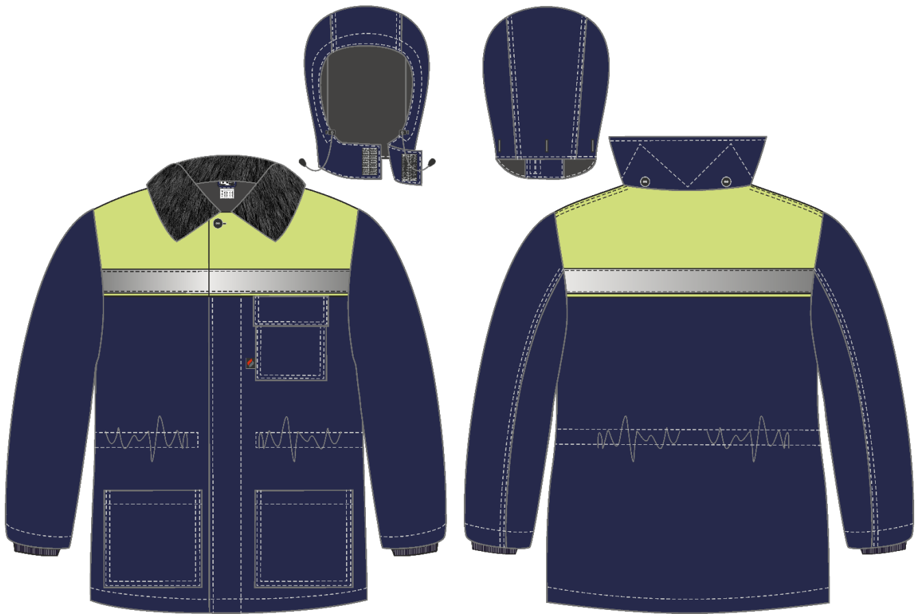
Рис. 1. Эскиз Костюм зимний Труженик-Ультра СОП (тк.Смесовая,210) брюки, т.синий/лимонный, куртка, вид спереди и сзади. Капюшон.