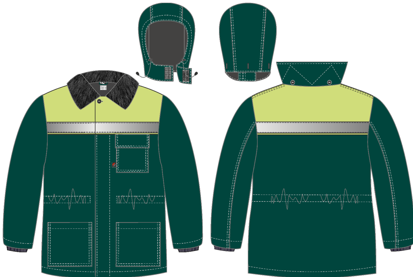
Рис. 3. Эскиз Костюм зимний Труженик-Ультра СОП (тк.Смесовая,210) брюки, т.зеленый/лимонный, куртка, вид спереди и сзади. Капюшон.