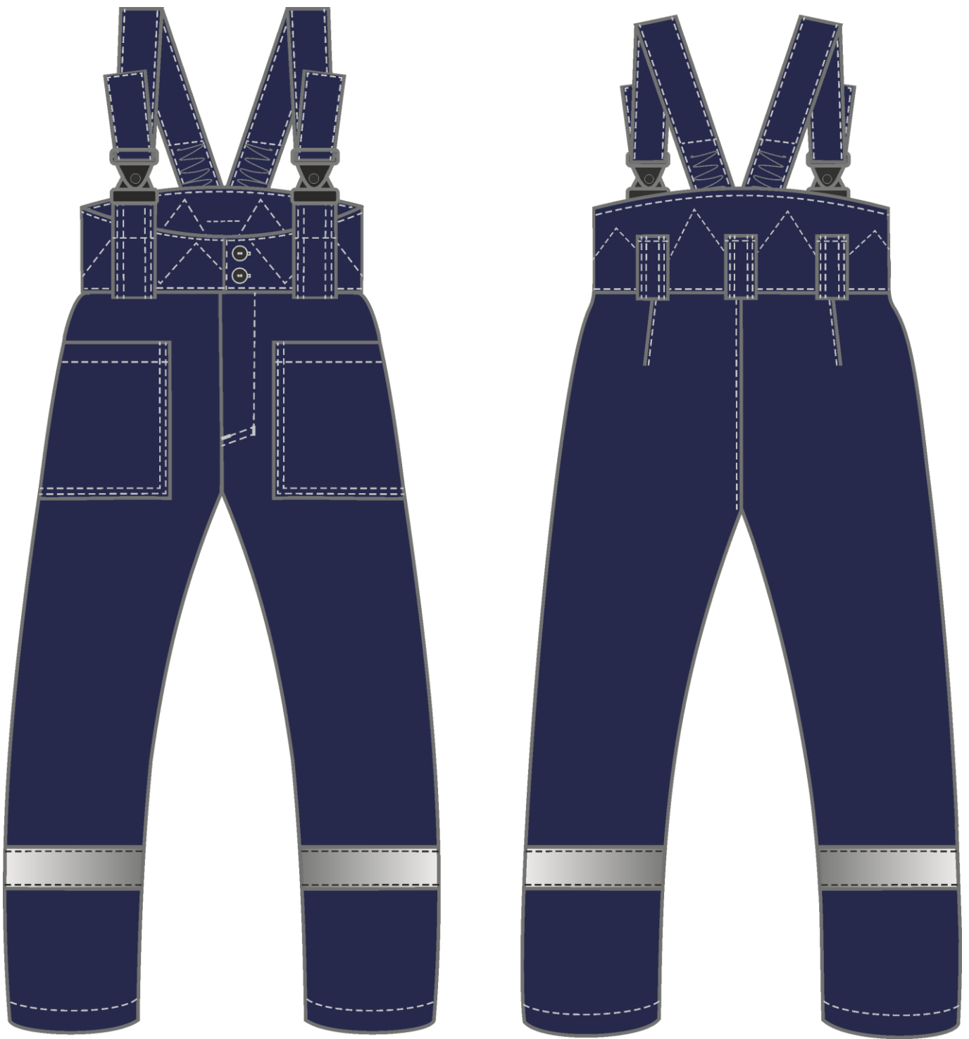
Рис. 6. Эскиз Костюм зимний Труженик-Ультра СОП (тк.Смесовая,210) брюки, т.синий/лимонный, васильковый вид спереди и сзади.