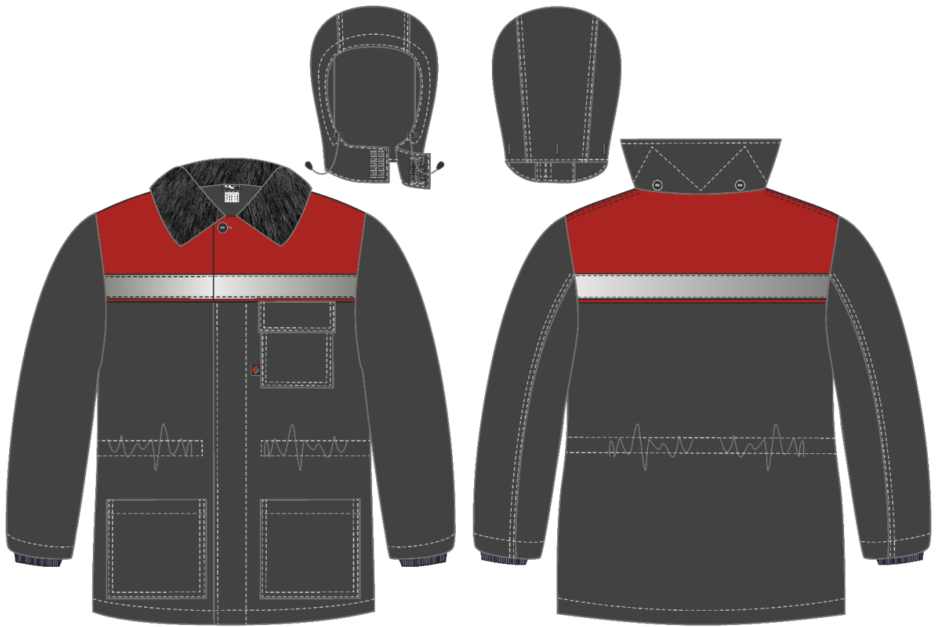
Рис. 5. Эскиз Костюм зимний Труженик-Ультра (тк.Смесовая,210) брюки, т.серый/красный, куртка, вид спереди и сзади. Капюшон.