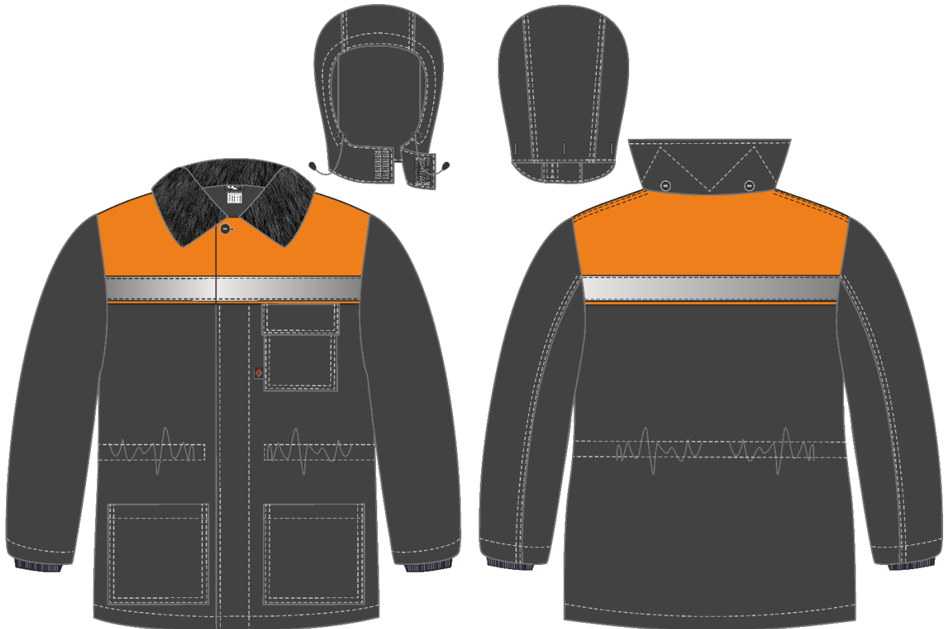
Рис. 2. Эскиз Костюм зимний Труженик-Ультра СОП (тк.Смесовая,210) брюки, т.серый/оранжевый, куртка, вид спереди и сзади. Капюшон.