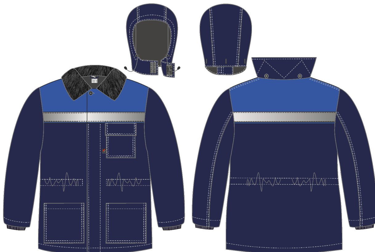
Рис. 4. Эскиз Костюм зимний Труженик-Ультра (тк.Смесовая,210) брюки, т.синий/васильковый, куртка, вид спереди и сзади. Капюшон.