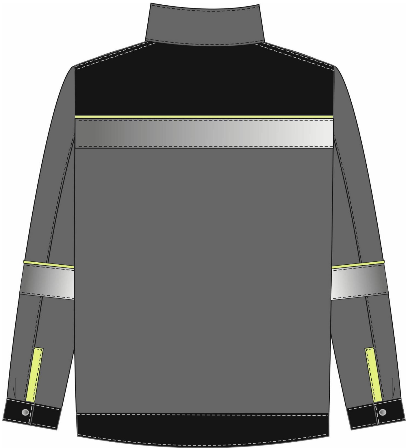
Рис.2. Эскиз Костюм Ховард-2 (тк.Смесовая,240) п/к, т.серый/черный/лимонный. Куртка, вид сзади.