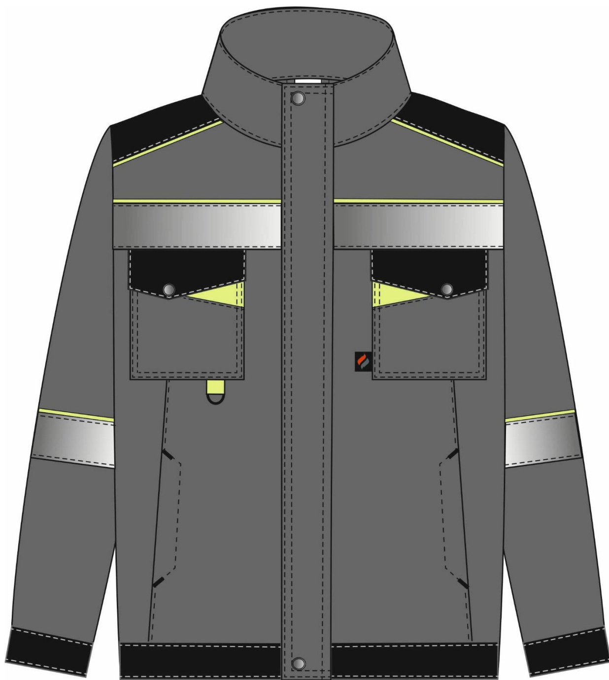
Рис.1. Эскиз Костюм Ховард-2 (тк.Смесовая,240) п/к, т.серый/черный/лимонный. Куртка, вид спереди.